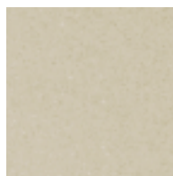
Beige / Beige

Autres teintes sur demande / Weitere Farben auf Anfrage