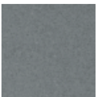
Anthracite / Anthrazit