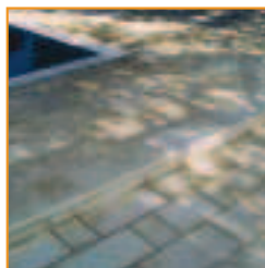
Dalles vieilles à bord arrondi (ensemble de 3 éléments) Antike Platten mit runder Kante (3er Pack)

Vendu par lot complet de 1,08 m 2 (3 dalles de chaque dimension) / Verkaufseinheit: 1,08 m 2 (3 Platten pro Größe)