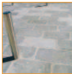
Dalles vieilles (ensemble de 3 éléments) Antike Platten (3er Pack)