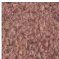
Porphyre / Porphyr