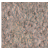
Grès de Luxembourg