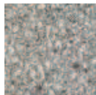
Granit gris / Granitgrau