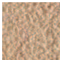
Quartz jaune / Quarzgelb