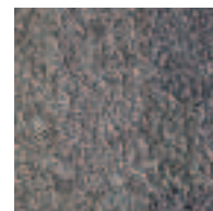
Basalte / Basalt

Autres teintes sur demande / Weitere Farben auf Anfrage