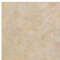
Calcaire vieilli / Beige