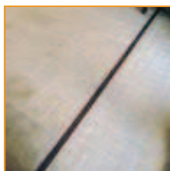
Plaque autocassante de 25 pavés Platte 25 Steine