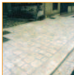
Pavés en 5 formats Pflastersteine 5 Formate

Pose unitaire / Die Steine werden einzeln verlegt